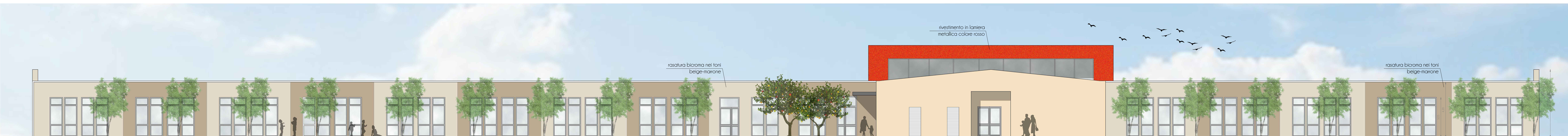
PROSPETTO OVEST _ scala 1:100