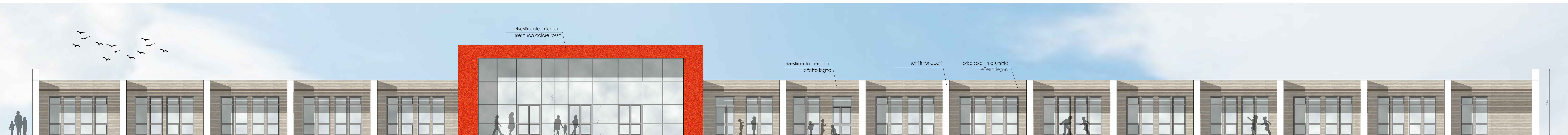
PROSPETTO EST _ scala 1:100