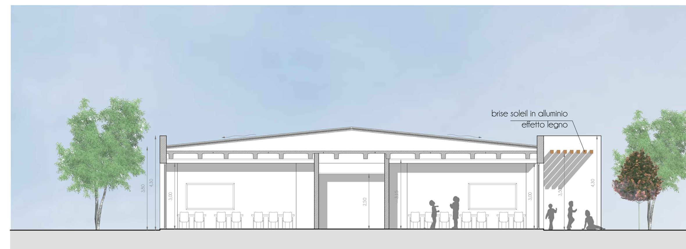
SEZIONE AA _ scala 1:100