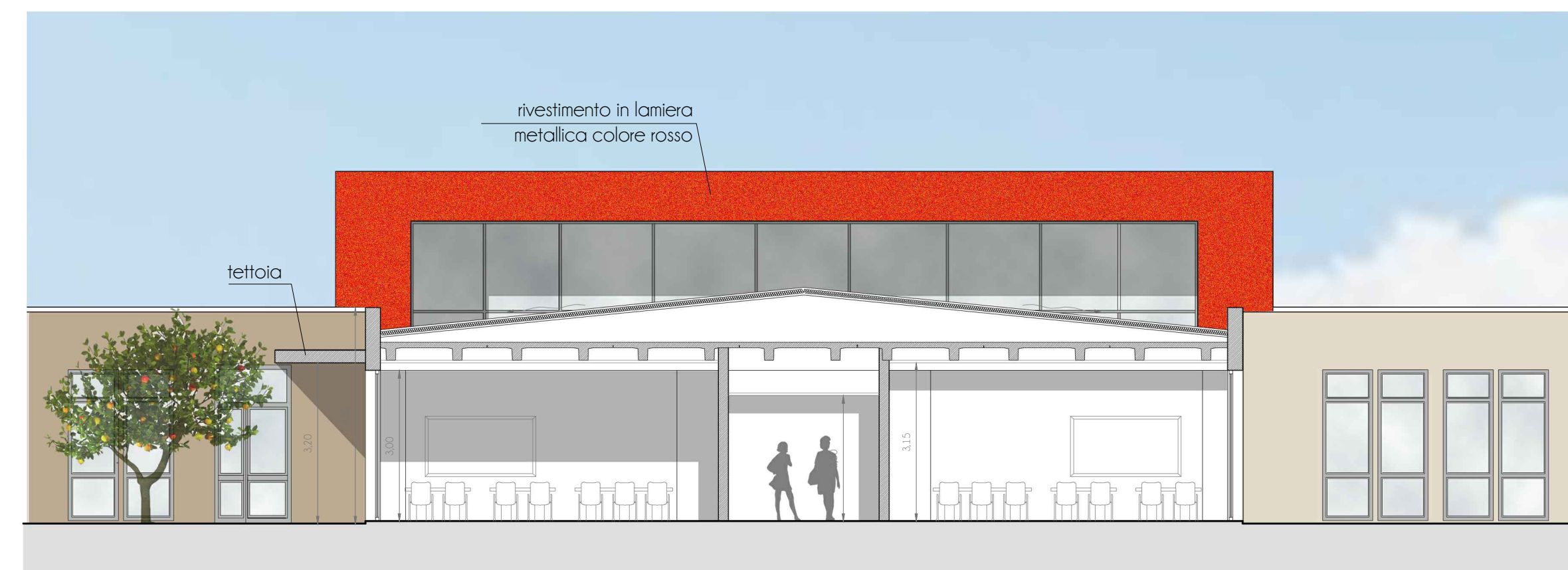
SEZIONE BB _ scala 1:100